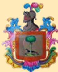
Accademia Arte e Vita

Grazie a tutti coloro che ci hanno offerto spunti di riflessione e donato le loro preziose energie